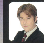
岡田 眞善 OKADA SHINZEN ラジオパーソナリティ